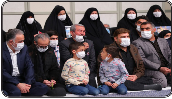
بخش های هنری، تبلیغی و نگارشی و همه دستگاه های فرهنگی است.

نتایج درخشان رواج گزاره عبور از مرزهای دانش در دو دهه قبل افزودند: جهش علمی و جهش فناوری از جمله آثار پر برکت آن حرکت بزرگ بود که باید استمرار یابد. حضرت آیت الله خامنه ای افزودند: دانشگاهها، مراکز علمی و تحقیقاتی و دستگاههای مرتبط، پیشرفت و جهش علمی را سرلوحه جدی کار قرار دهند تا کشورمان از قافله علم عقب نیفتد.