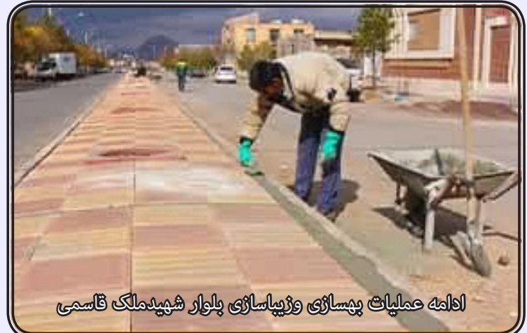
ادامه عملیات بهسازی و زیباسازی بلوار شهید ملک قاسمی