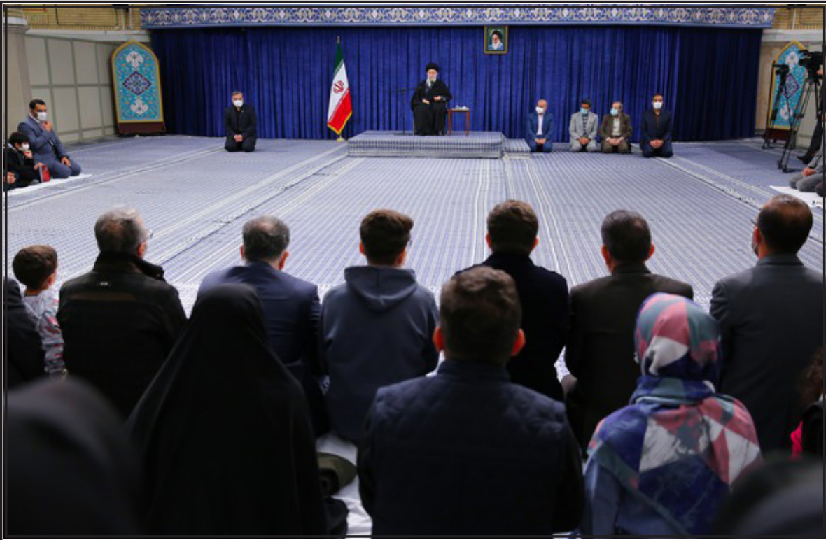
در دیدار خانواده‌های شهدای حادثه تروریستی حرم مطهر شاهچراغ:

باتوجه به شمار بالای فعالان رسانه‌ای حاضر در این نشست در محل هتل جهانگردی شهر کرمان و پرسش‌های متعدد، نشست حدود سه ساعت به طول انجامید و خبرنگاران به عنوان نمایندگان