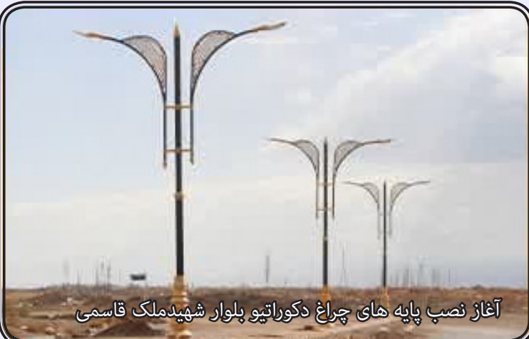
آغاز نصب پایه‌های چراغ دکوراتیو بلوار شهید ملک قاسمی

مهندس شاه حیدری پور شهردار بردسیر از اتمام عملیات بهسازی، زیباسازی و روشنایی بلوار آزادگان با اعتباری بالغ بر یک میلیارد و پانصد میلیون تومان خبر داد. این پروژه شامل اجرای فرش موزائیک، پیاده‌رو سازی، روشنایی (نصب پایه چراغ‌های دکوراتیو)، بهسازی رفوژ میانی، درختکاری، نصب سیستم آبیاری قطره‌ای می‌باشد.