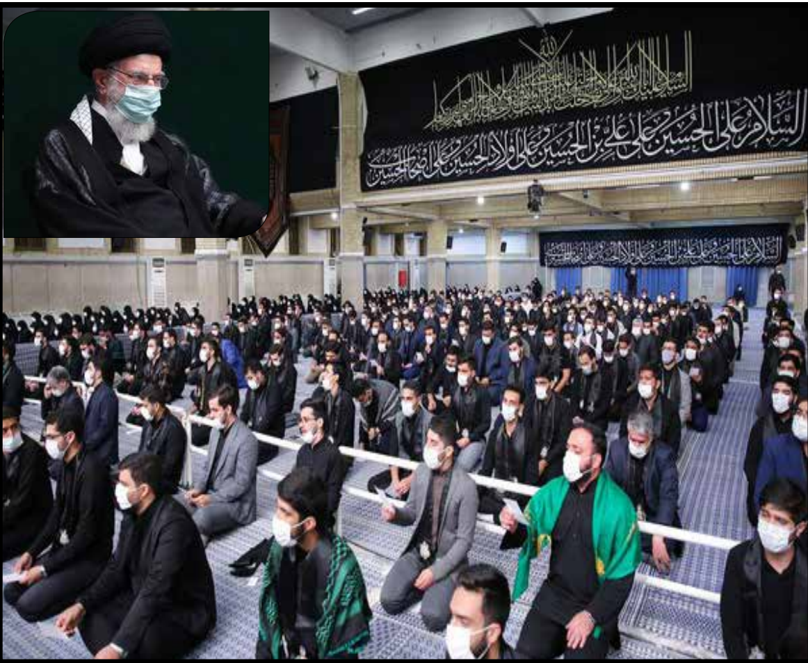
رهبر معظم انقلاب اسلامی در مراسم عزاداری دانشجویان به مناسبت اربعین حسینی علیه‌السلام:

گفت: عضویت رسمی ایران در سازمان شانگهای زمینه خوبی را جهت ارتباط در زیرساخت‌های اقتصادی منطقه برای فعالان اقتصادی کشورمان فراهم می‌کند و از همه فعالان اقتصادی و نگاه‌های تولیدی می‌خواهم با توجه به استقبال کشورهای منطقه برای همکاری با ایران و استفاده از کالاهای ساخت کشورمان، کار و تلاش خود را در مسیر بهره‌گرفتن از این فرصت مضاعف کنند. رئیس‌جمهور افزود: آنچه در نتیجه این سفر و رایزنی‌های انجام شده در آن حاصل شد، نشان می‌دهد که تلاش دشمن برای به انزوا کشاندن جمهوری اسلامی ایران با تهدید و تحریم، با شکست مواجه شده است و امروز همه کشورها علاقمند به گسترش همکاری‌ها و روابط خود با ایران هستند.